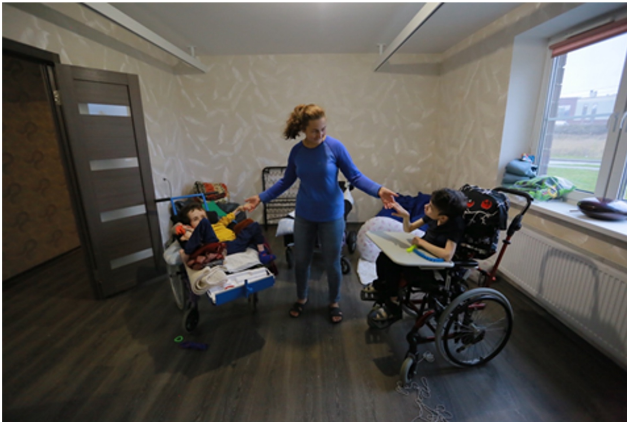
Санкт-Петербургские "Перспективы". Квартира сопровождаемого проживания на Еремеева (г.Санкт-Петербург, ул. Еремеева) https://perspektivy.ru/