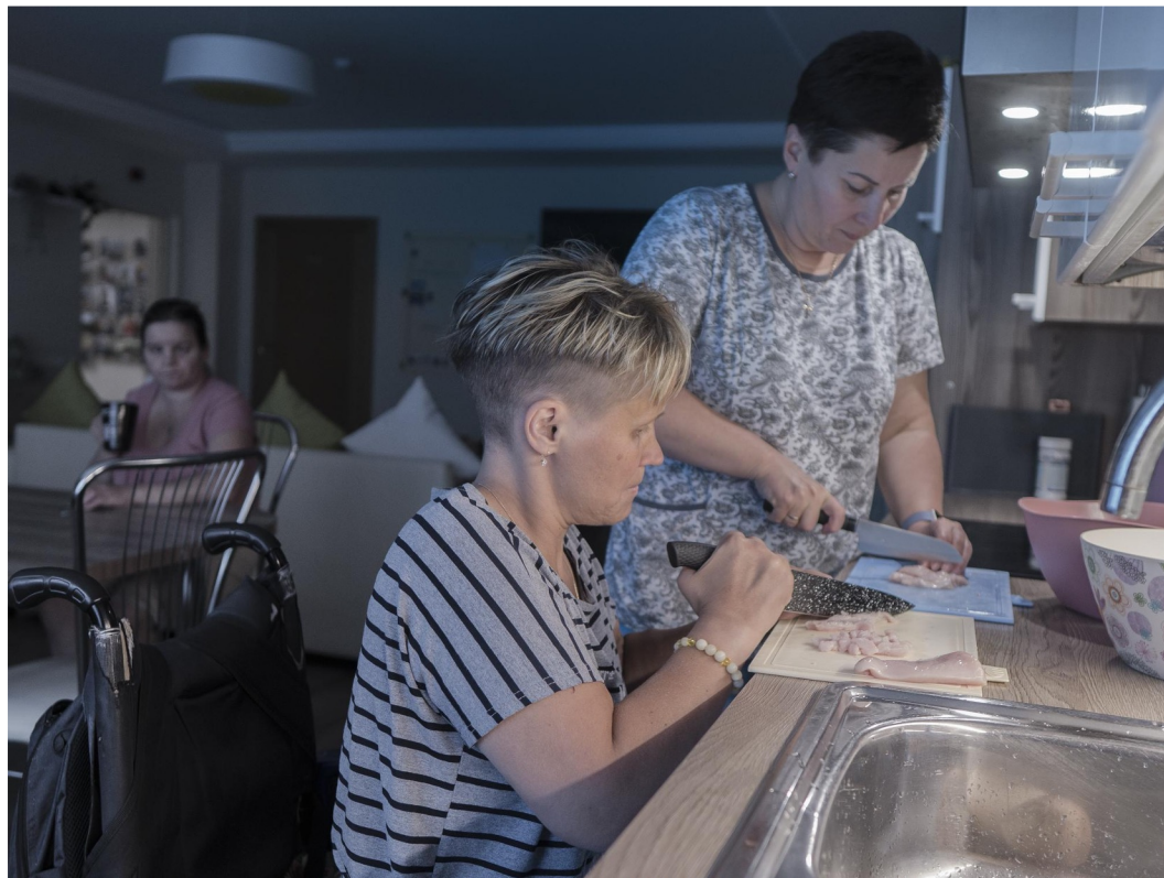
ГАООРДИ (Санкт-Петербург). Санкт-Петербург, пр. Обуховской Обороны, д. 199 https://gaoordi.ru/