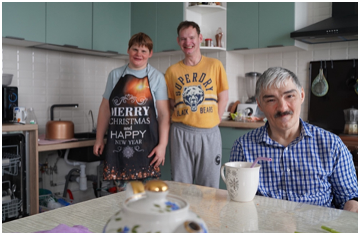
Санкт-Петербургские "Перспективы". Квартира сопровождаемого проживания на Морской (г.Санкт-Петербург, Морская набережная) https://perspektivy.ru/