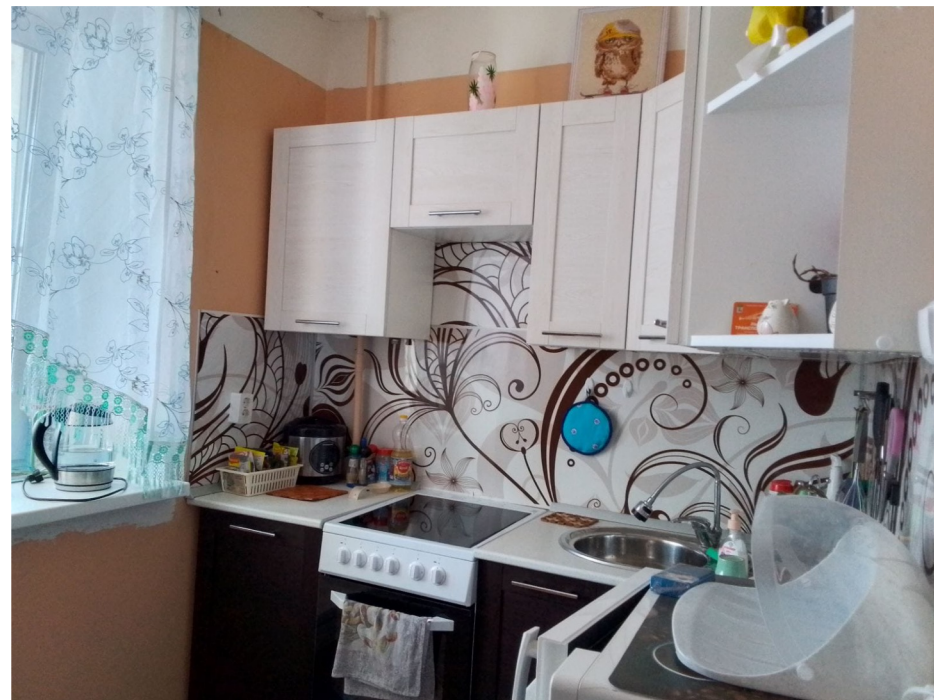
ГБУ "Центр социального обслуживания граждан пожилого возраста и инвалидов Богородского района Нижегородской области"