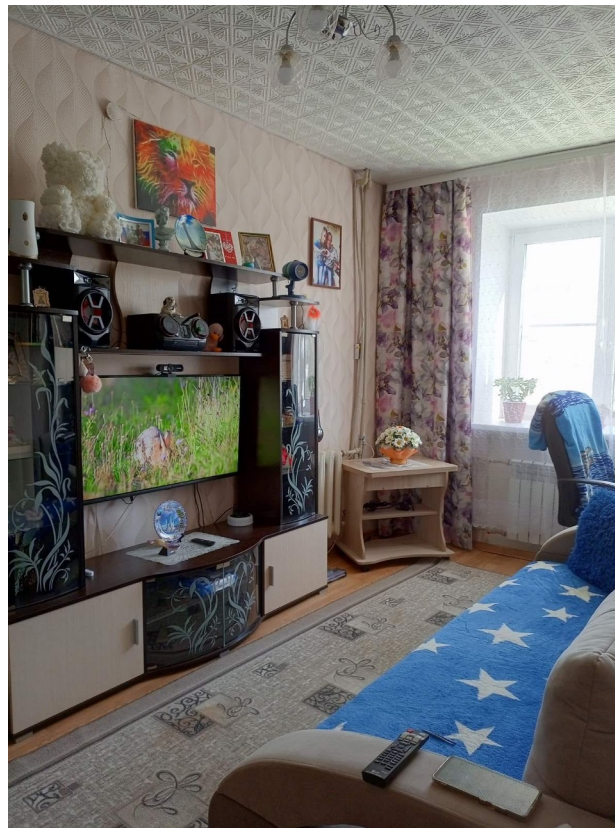
ГБУ "Центр социального обслуживания граждан пожилого возраста и инвалидов Богородского района Нижегородской области"